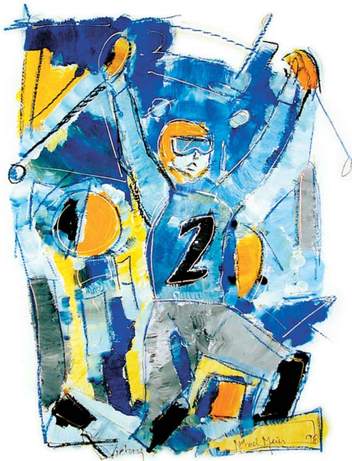
Titelbild von Mike Meier